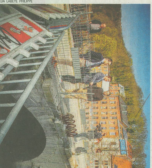
Ici, le secrétaire d'État découvrant la proximité avec la Vesdre.